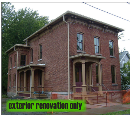
504 Niagara Street $30,000

This 2-unit, potentially mixed-use property, is being sold as a partial renovation. Will have full exterior renovation to historic standards!