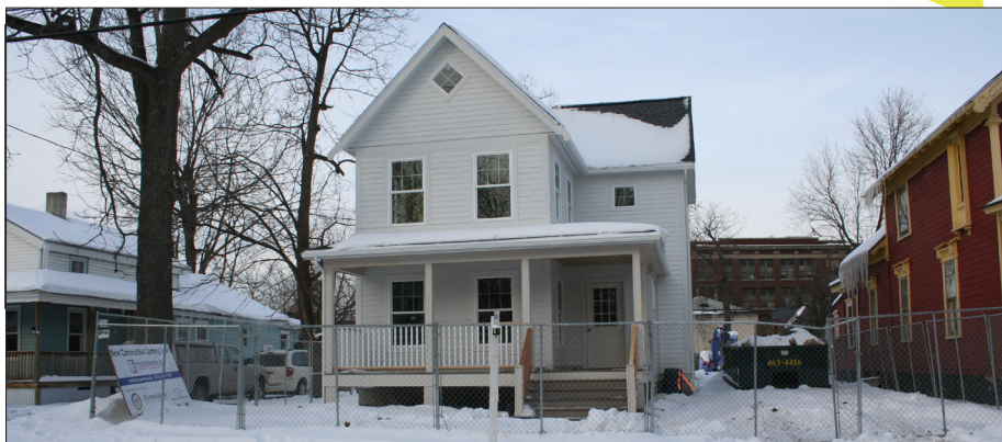
526 Gifford Street $76,000*

New Construction. Spacious single family home. 3 bdrm, 1.5 bath home with 1st floor laundry.