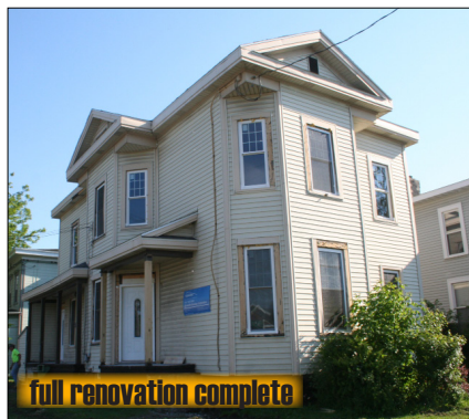
501 Marcellus Street $69,900*

New Construction. Spacious single family home. 3 bdrm, 1.5 bath home with 1st floor laundry.