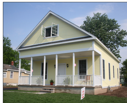
626 Gifford Street - $75,000* New construction. Single family home. 3 bdrms, 2.5 baths. Visitable home with convenient no-step entrance, open floor plan on the main floor, first floor living, spacious first-floor bath and wider doorways.