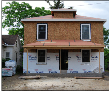
520-22 Fabius Street - Starting at $85,000* Single family home with 4 bedrooms and 2 bathrooms