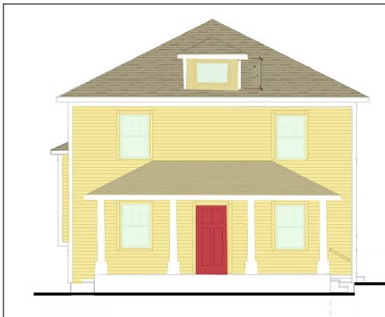
408 Otisco Street - Starting at $85,000* Single family home with 4 bedrooms and 2 bathrooms. The graphic is a rendering and may not show actual color choices.

*All purchase prices are estimated & may include buy downs based on buyer eligibility