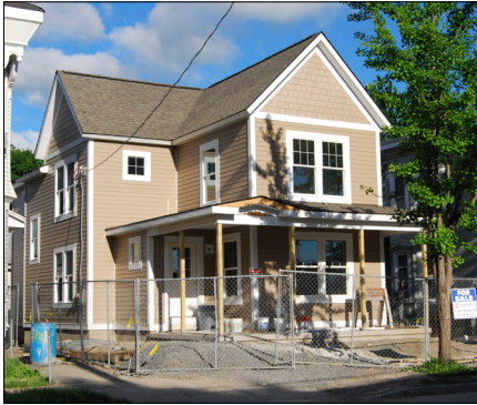
206 Oswego Street - Starting at $77,000* Single family home with 4 bedrooms and 2 bathrooms